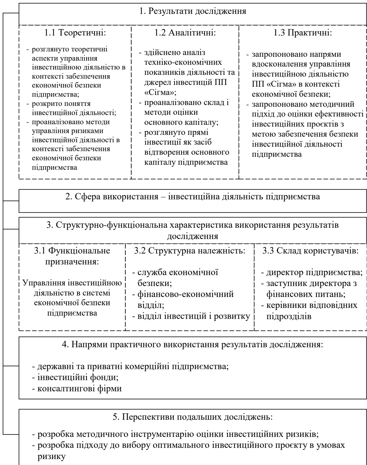
Рисунок Е.1 – Структурно-логічна схема результатів дослідження