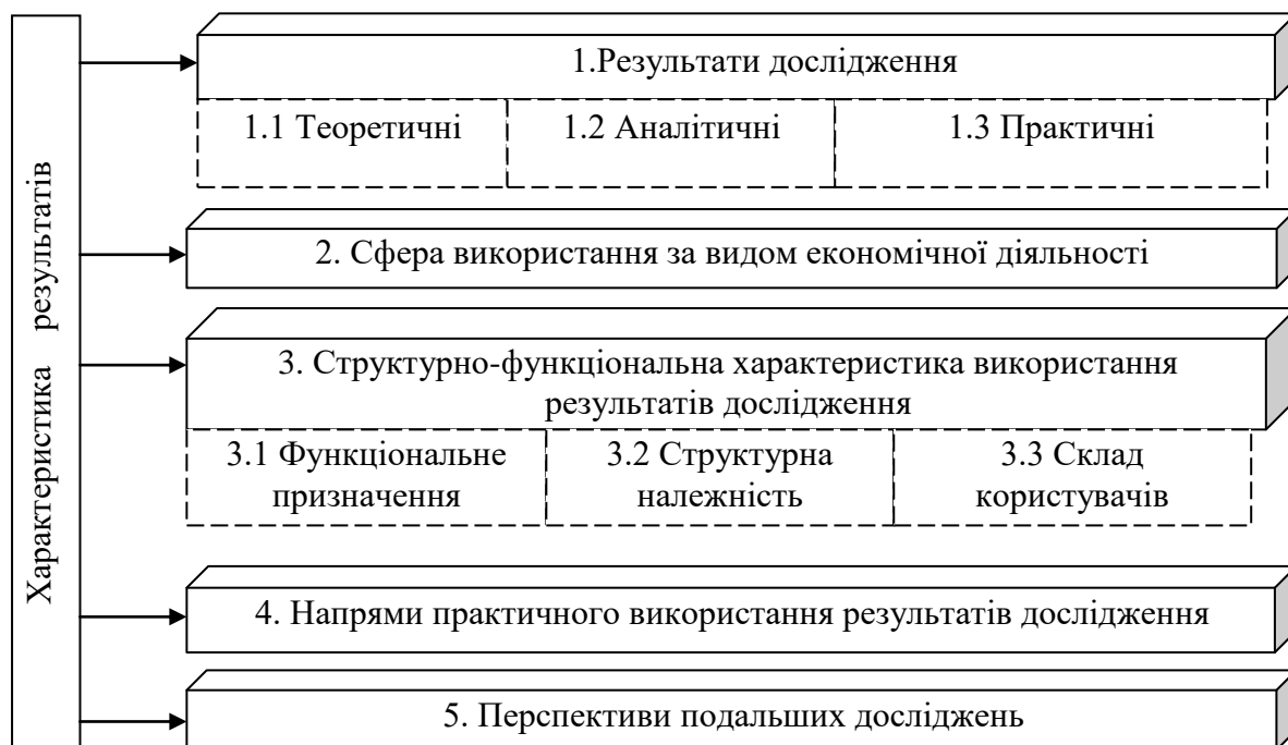
Рисунок 3.1 – Структурно-логічна схема результатів дослідження

Структурно-логічна схема результатів дослідження за темою кваліфікаційної роботи (рис. 3.1) містить основні результати проведених досліджень та перелік рекомендацій щодо подальшого їх використання в обраній сфері діяльності.